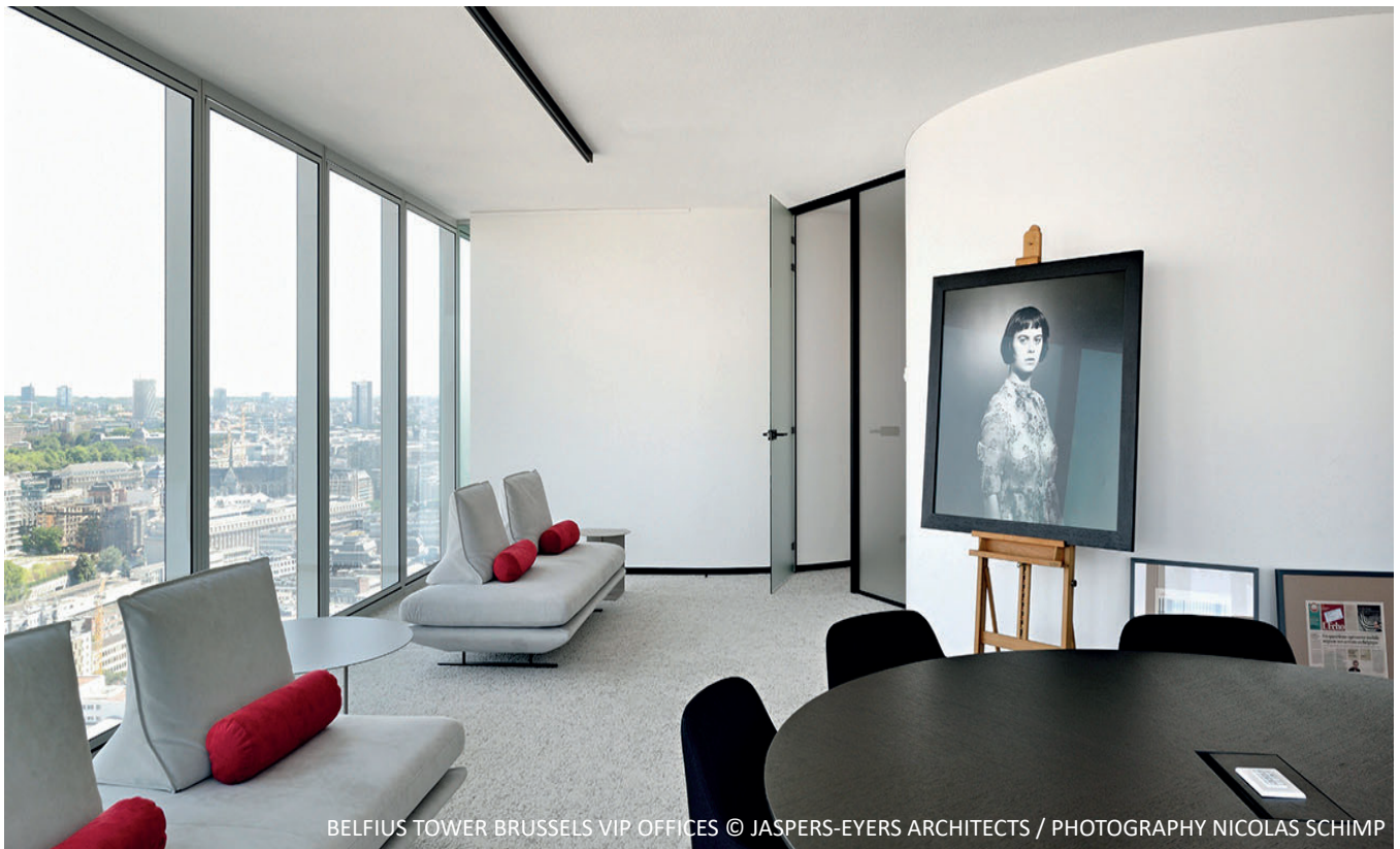
BELFIUS TOWER BRUSSELS VIP OFFICES © JASPERS-EYERS ARCHITECTS / PHOTOGRAPHY NICOLAS SCHIMP